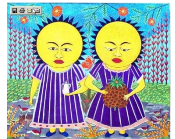
Représentation picturale des lwas jumeaux.

Les lwas jumeaux savent faire tomber la pluie,, conseiller les malades, et les docteurs-feuille pour choisir les plantes qui guérissent.... Ils sont invoqués juste après Papa Legba dans les cérémonies. Leur gémellité les apparente à certains dieux androgynes d'autres mythologies (africaine ou grecque ancienne). Ils symbolisent l'harmonie première, l'union originelle du ciel et de la terre, du jour et de la nuit, ils réunissent les contraires. Mais en tant que tels, car ils rassemblent des éléments opposés, ils sont jaloux et vindicatifs, parfois violents si on les oublie.